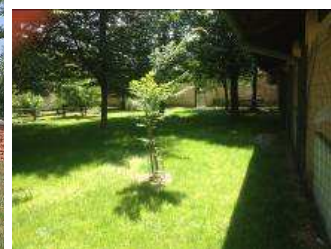
(il nuovo prato di C.na Brero)