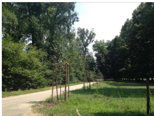
(i nuovi alberi presso il Borgo di Giada onlus)

Piantare un albero è un'azione che richiama la vita e proprio con questo intento le onlus Progetto Giada e Silviadizenzero, dopo avere raccolto fondi per iniziative in memoria di persone care mancate a causa di malattia, hanno donato tredici piante di tiglio al parco, sostenendo il costo della fornitura e della messa a dimora. Le piante vivono ora presso i Viali dell'Otto, dove si può anche leggere la targa voluta dalle associazioni.