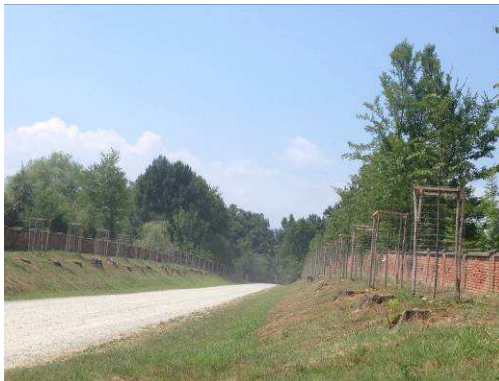
(il nuovo viale di Rampa Ciuchè)